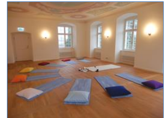
PUK - Rheinau